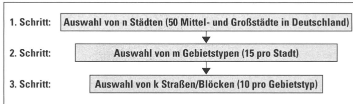
Abbildung 1: Verfahren der Stichprobenziehung.

nahmen rationaler begründet werden können als dies bisher der Fall ist. Insgesamt ist damit zu rechnen, dass auf diese Weise der gesellschaftliche und politische Stellenwert urbaner Freiräume (wieder) erhöht wird.