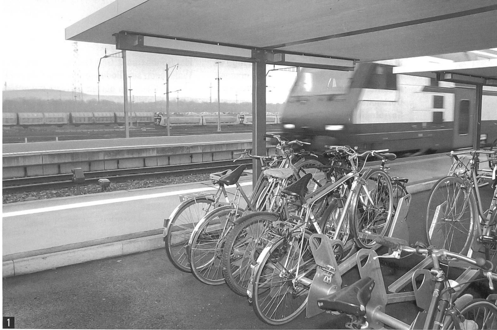
1 Attraktive Velo-Infrastruktur und velofreundliche Verkehrsplanung motiviert zum Umsteigen aufs Velo.