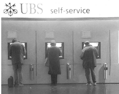
Hochspezialisierte private aber öffentlich genutzte Räume

Der Mythos des öffentlichen Raums des 19. Jahrhunderts ist allgegenwärtig. Obwohl er nur ein historisierendes Konstrukt ist, welches idealisierend wenige Aspekte herausfiltert, dient er doch als Massstab, vor dem das Stadtbild von heute nicht bestehen kann. Betrachtet man die Wunschvorstellungen sowohl geplanter wie auch gebauter zeitgenössischer öffentlicher Räume, wird klar, wie eng gerade in jüngster Vergangenheit die kollektive Vorstellung von öffentlichen Räumen mit der bürgerlichen Stadt des 19. Jahrhunderts verbunden ist. Bilder von Cafés, Boutiquen und flanierenden Menschen porträtieren eine Freizeitgesellschaft die sich in dichten und funktionsüberlagerten Räumen bewegt. Dies steht oft in Widerspruch mit den öffentlichen Räumen, die wir heute in unseren Städten vorfinden, wo der grösste Teil der Strassen und Plätze von Funktionen weitgehend entleerte Transiträume sind. In der Stadtplanung ist eine gewisse Ratlosigkeit festzustellen, in der die Planer immer mehr mit idealisierten Vorstellungen der Stadträume des 19. Jahrhunderts konfrontiert werden.