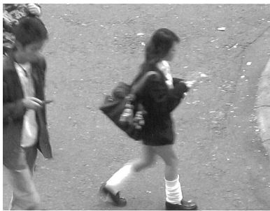
Neue Formen der Kommunikation