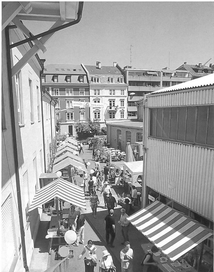
Gundeldinger Feld: Das ehemalige Industrie Areal wird zum lebendigen Begegnungszentrum.