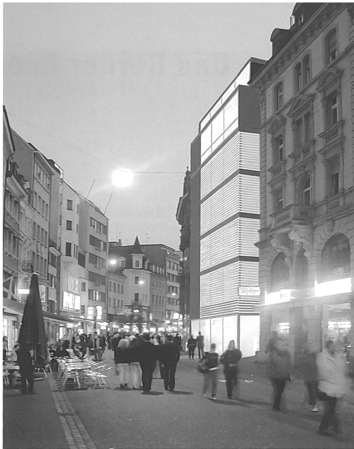
Minergie-P in der Basler Altstadt: Neubau des Kundenentrums der Industriellen Werke Basel.