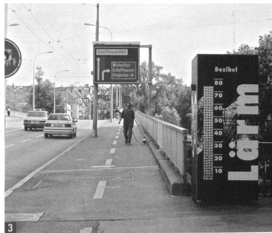
Illustration: Fachstelle Lärmschutz / Dani Aebli / 2004

2 Seit September 2004 ist die Fachstelle Lärmschutz (FALS) des Kantons Zürich mit neu gestalteten Info-Stellwänden unterwegs (Bild: Mettmenstetten 2004). Die Stellwände informieren in den vom Strassenlärm am meisten betroffenen Gemeinden über Schall, Lärm und Mobilität.