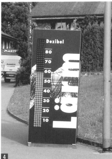
Illustration: Fachstelle Lärmschutz / Dani Aebli / 2002