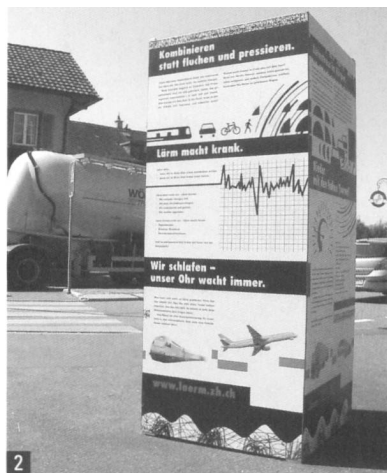
Illustration: Fachstelle Lärmschutz / Dani Aebli / 2004

Die Display-Kampagne findet deshalb an verkehrsreichen Strassen innerorts mit Wohnanteil statt. Als Grundlage wollen wir den Fahrzeugkern und Passantinnen zeigen,