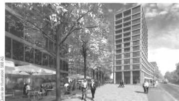
Visualisierungen des neuen Stadtteils HB Südwest.

Die Beurteilung nach Gender-Kriterien des Projekts «Stadtraum HB Zürich, Öffentlicher Raum» basiert auf raumrelevanten sozialen Bedürfnissen aus der Perspektive der späteren Nutzerinnen und Nutzer. Durch einen Gender-Kriterienkatalog wird die Voraussetzung für die Wahrnehmung dieser Bedürfnisse an den öffentlichen Raum des Stadtraums HB sowie deren Umgebung geschaffen. Der Gender-Kriterienkatalog wurde gemäss folgenden Themenbereichen aufgebaut: • Beschreibung Ort oder Thema • Schwachstelle aus Gender-Perspektive • Soziale Bedürfnisse, Gender-Kriterium • Optimierungsvorschläge • Empfohlene Priorität