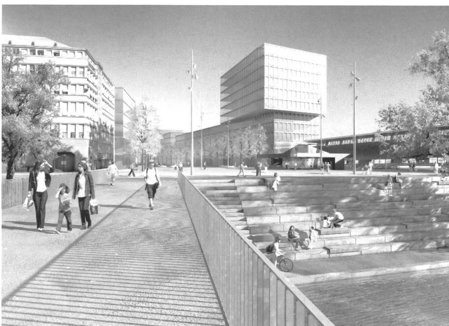
Visualisierung des neuen Stadtteils HB Südwest.