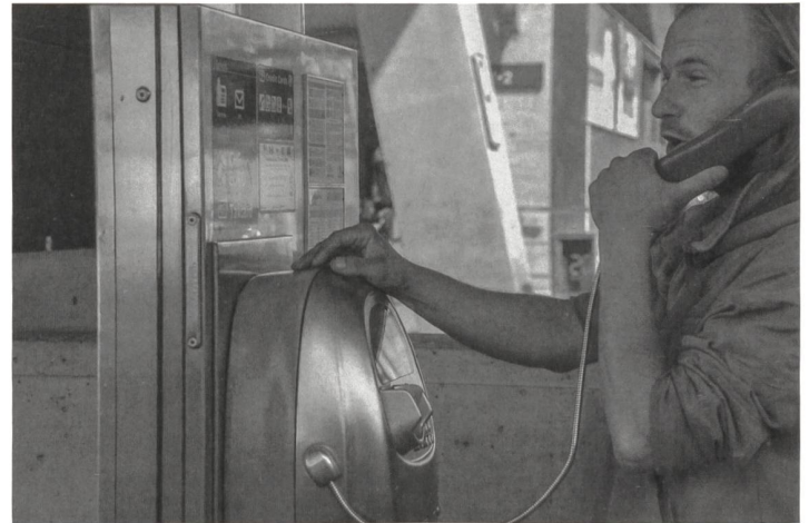
... Hektik, .../... cohue , ... (Basel)