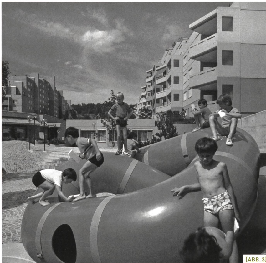
[ABB. 3] Das Zentrum der Siedlung Sonnhalde in Adlikon b. Regensdorf ZH mit «Lozziwurm».