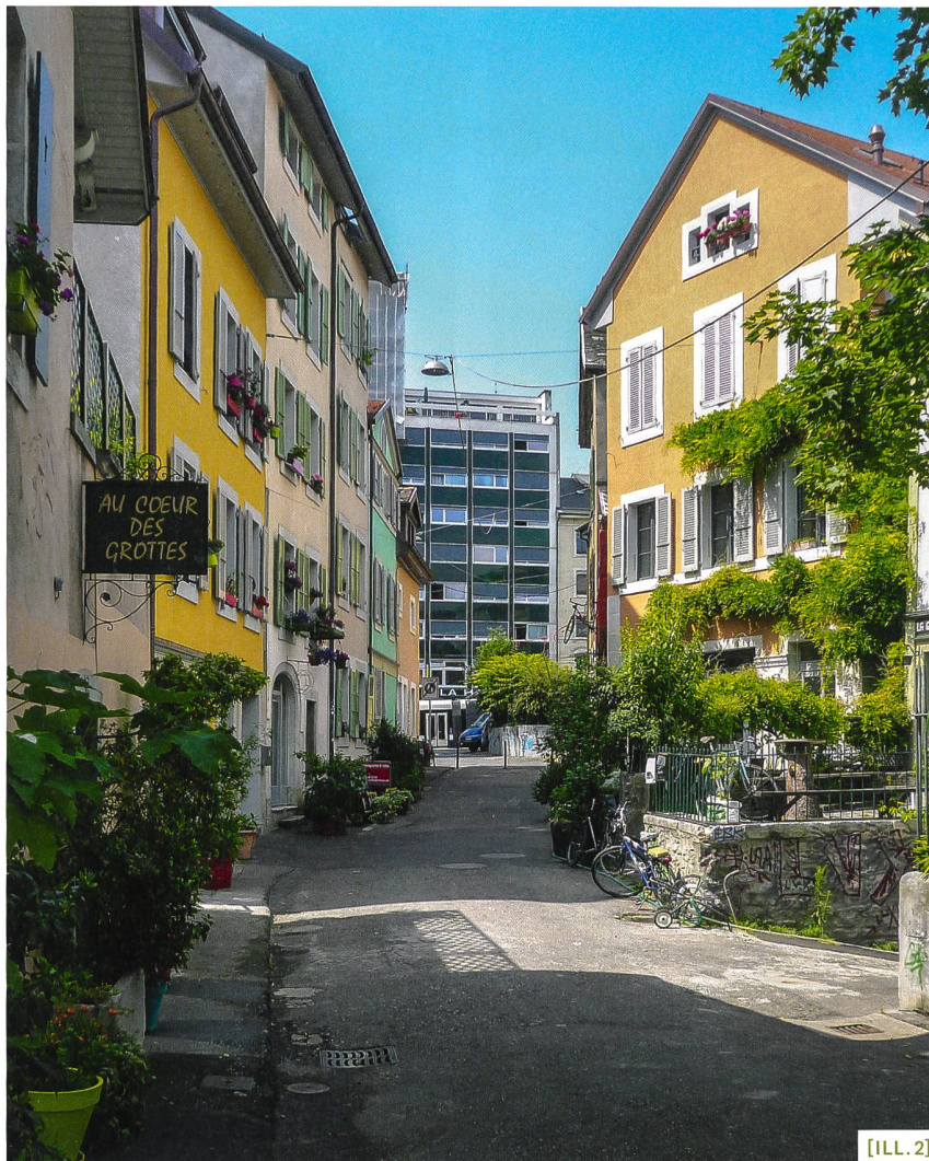
[ILL. 2] Rue de l'Industrie.