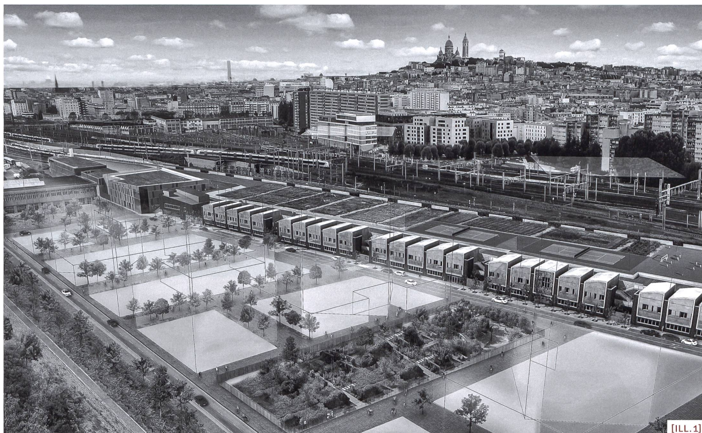
[ILL.1] Hôtel logistique SOGARIS de Chapelle International Paris 18 ème arr.

Propos recueillis par Oscar Gential et Jean-Daniel Rickli, rédaction de COLLAGE.