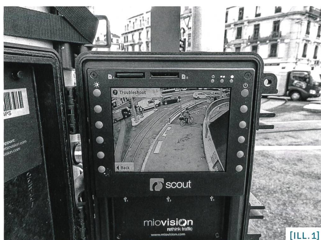
[ILL.1] Méthodologie d'étude: l'analyse quantitative des conflits entre vélos électriques et autres usagers se base sur les données récoltées par enregistrement vidéo à Berne et à Genève.