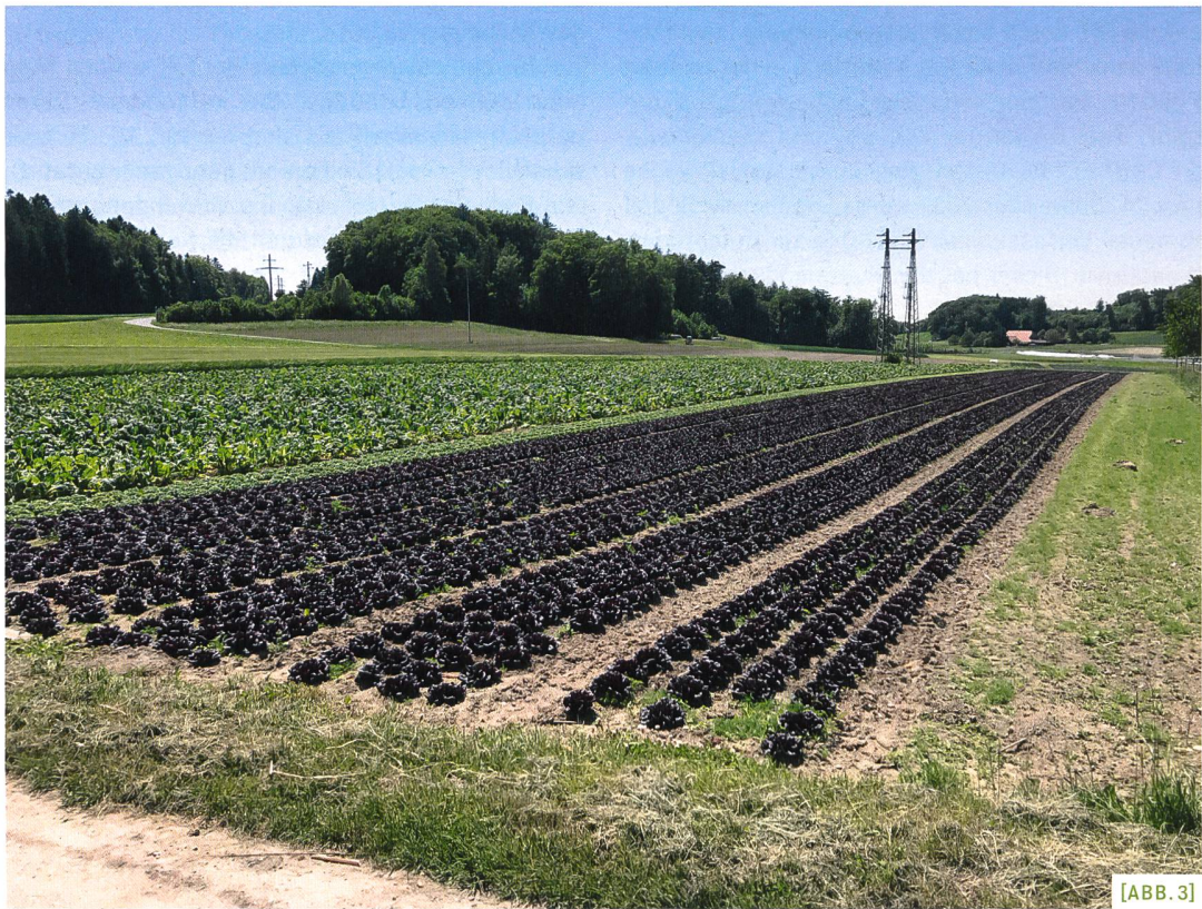
[ABB. 2+3] Die Sicherung der Fruchtfolgeflächen trägt zu unserer Versorgungssicherheit in schweren Mangellagen bei.