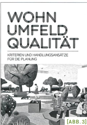
[ABB. 3] Das Handbuch stellt den Planungsakteuren und Planungsakteurinnen Handlungsgrundlagen für die Sicherung und Entwicklung eines attraktiven Wohnumfelds zur Verfügung.