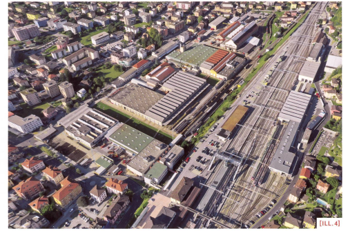
[ILL. 4] Vista dall'alto delle Officine FFS di Bellinzona / Blick über die SBB-Werkstätten von Bellinzona / Vue aérienne des Ateliers CFF de Bellinzona.