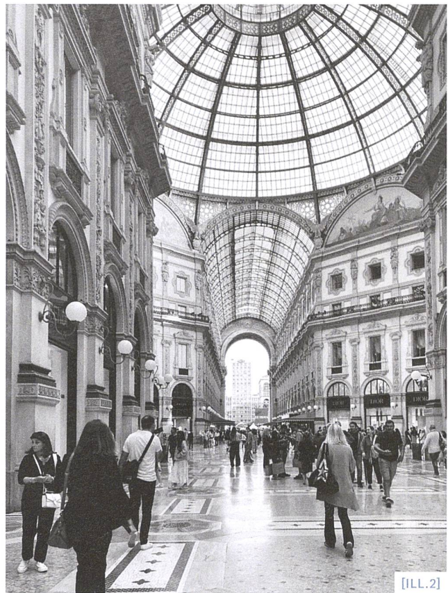
[ILL.2] Galleria Vittorio Emanuele II, Milano