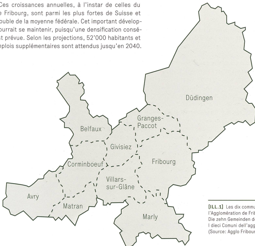
[ILL.1] Les dix communes formant l'Agglomération de Fribourg / Die zehn Gemeinden der Agglomeration Freiburg / I dieci Comuni dell'agglomerato friborghese

Ces dynamiques de développement démographique, combinées à l'urgence climatique, nécessitent une politique de mobilité durable et attractive. Cette dernière passe obligatoirement par une pratique forte du vélo grâce à un réseau séduisant les utilisateurs.