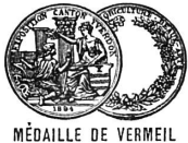
MÉDAILLE DE VERMEIL