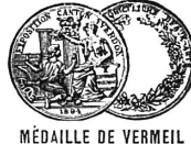
MÉDAILLE DE VERMEIL