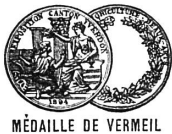
MÉDAILLE DE VERMEIL

LAUSANNE | MAGASIN CH. IMHOF | LAUSANNE 13, Place St-François | SUCCESEUR DE | Place St-François, 13 Th. BETTING