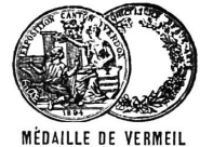
MÉDAILLE DE VERMEIL