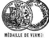
MÉDAILLE DE VERMEIL