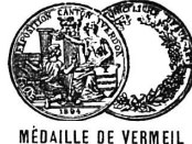
MÉDAILLE DE VERMEIL