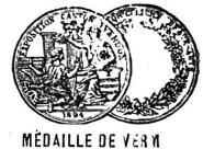
MÉDAILLE DE VERMEIL