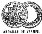
MÉDAILLE DE VERMEIL