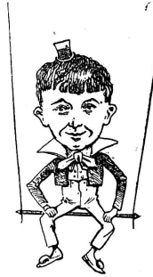
Au Musée des souvenirs.

— Oh ! alors, vous pouvez être tranquille, elle est bien morte.