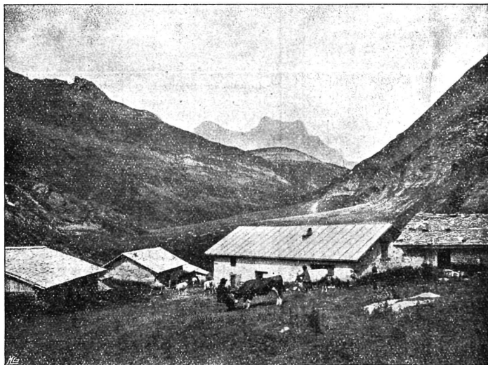
Les chalets de La Varraz.