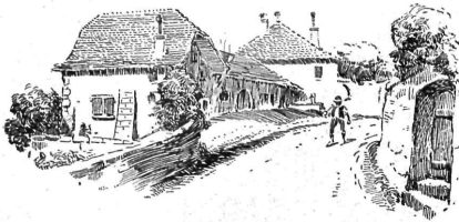
TABLEAU VILLAGEOIS Le petit village.