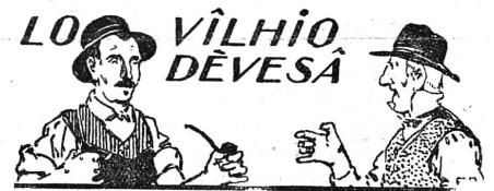
LE TRAI (Patois d'Argle)