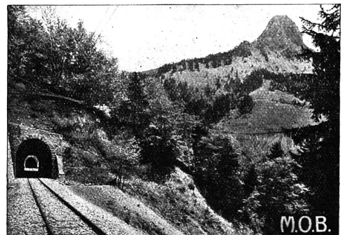
Le tunnel et Dent de Jaman

Chemin de fer électrique Montreux-Oberland bernois