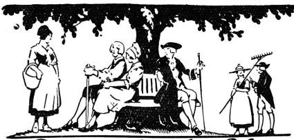
Pages d'autrefois LE REVENANT DU FAUBLANC

Dans l'auberge communale. — Jean-Daniel conte ses mésaventures : — J'avais donc allumé ma pipe, et je fumais dans mon lit. Puis je me suis endormi. Mais voilà que je m'éveille avec une chaleur épouvantable... Mon lit était en feu... Alors... François, intéressé, l'interrompt : — Est-ce que tu as eu le temps de sauver la vache ?