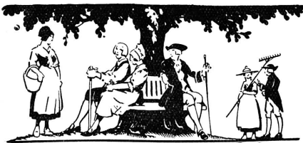
Pages d'autrefois LE REVENANT DU FAUBLANC

François, intéressé, l'interrompt : — Est-ce que tu as eu le temps de sauver la vache ?