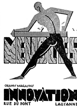
ORANSY MAGAZIN INNOVATION RUE DU PONT LAUSANNE