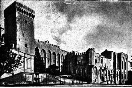
Château des Papes.

— La visite dure environ deux heures, déclare le chauffeur. Quand vous aurez parcouru toutes les salles, vous monterez au sommet de la Tour des Trouillas !