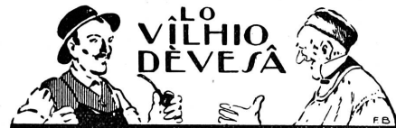
CLIAO CRASET DE BOUBO !

Nous expédions le Conteur Vaudois à l'essai, espérant qu'un grand nombre de nos compatriotes comprendront qu'en s'y abonnant, ils encourageront les amis du patois et des coutumes vaudoises.