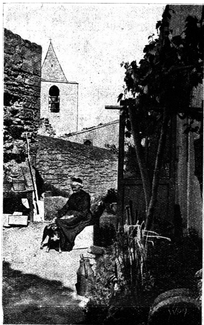
LES BAUX — Un coin du Vieux Village.

— Ces tonnerres de Méridionaux, il n'y en a point comme eux. C'est bien le cas de dire : « Poison de souleil ! ».