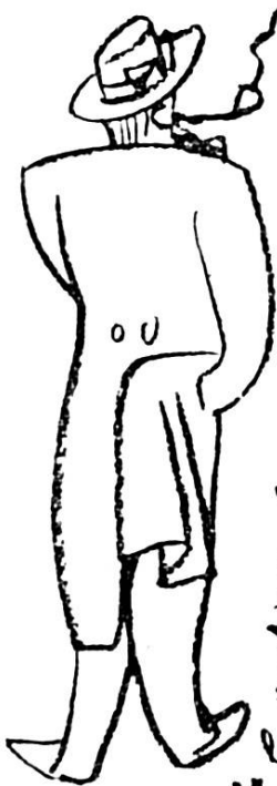
un pasteur de la nationale.