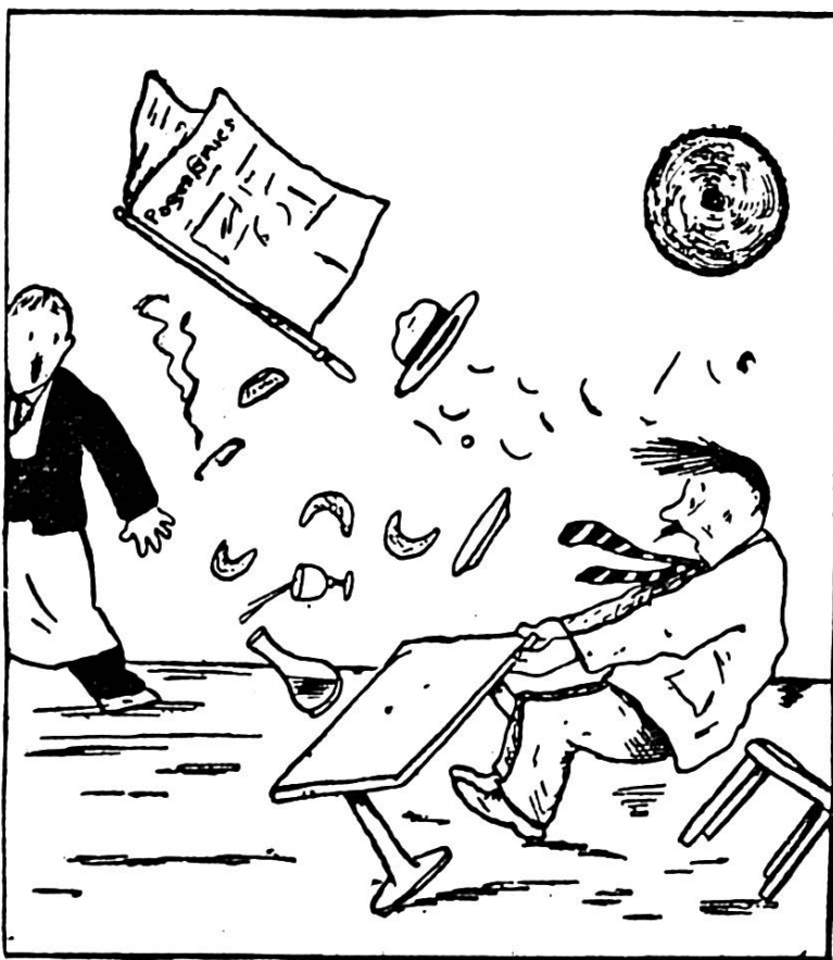
Le « 1948 »

Si au lieu de le baptiser le « Rubattel » on l'appelait... « La Vaudaire » !