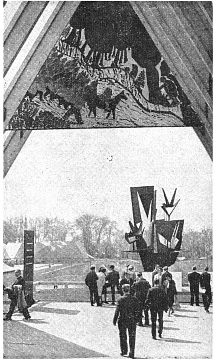
Dernière vision de l'« Expo 64 » : Le Serment des Trois Suisses!

sentés.) Quant aux disques, leur exploitation commerciale (vente du solde, rééditions, créations éventuelles et publicité) va être confiée à une importante maison spécialisée que nous vous indiquerons en temps opportun. En attendant que soient signés les contrats, le soussigné reste à votre disposition pour vous envoyer le disque qui manque encore à votre collection ou que vous vous ferez un plaisir d'offrir à vos amis.