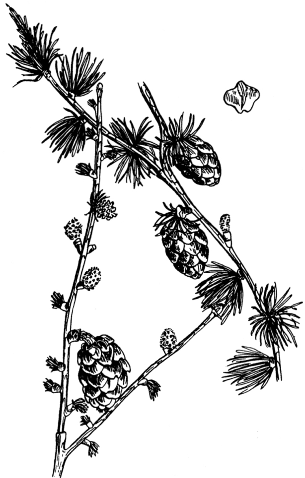
Nadelaustrieb der Lärche

Die Pflanzen und somit auch die Eintrittstermine der Phänophasen werden von einer Vielzahl von Umweltfaktoren beeinflusst. Neben der Vererbung sind die Bodenverhältnisse, Schädlinge, Krankheiten, Schadstoffe sowie die atmosphärischen Bedingungen von Bedeutung. Bei den meteorologischen Einflussgrößen spielt nicht nur das aktuelle Wetter und der Witterungsverlauf der laufenden Vegetationsperiode eine wichtige Rolle, sondern auch die Witterung vergangener Vegetationsperioden und der Ruhephasen (Winter). Ergebnisse eingehender Untersuchungen wurden in der Arbeit „Pflanzenphänologie der Schweiz“ (Defila, 1991) zusammengefasst. Phänologische Daten können bei Ernteprognosen, Frostwarnungen, im integrierten Pflanzenschutz, bei Pollenprognosen und bei Untersuchungen von Schäden in der Biosphäre eine wertvolle Hilfe sein.