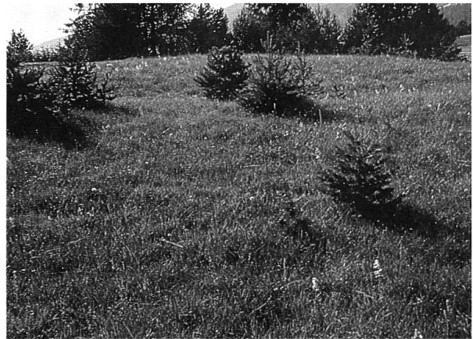
Abb. 2: Beispiel für die Meso-Ebene der Betrachtung eines Landschaftsausschnittes.

Bei den Inhaltsanalysen der Gespräche wurde nach dem Ansatz der „grounded theory“ von Glaser & Strauss (1967) vorgegangen: Als erstes mussten die Tonbandaufzeichnungen niedergeschrieben werden. In einer Zeile-für-Zeile-Analyse der vollen Interviewtexte wurden dann Kategorien gebildet, welche die konkreten Aspekte des Bracheerlebnisses verallgemeinern. In einem nächsten Schritt wurde gezielt nach den sogenannten Schlüsselkategorien gesucht, die sich durch Dominanz und Häufigkeit gegenüber den untergeordneten Kategorien aus-