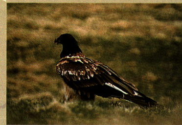
Val da Stabelchod: Aussetzungsort der Bartgeier. Im Bild das Männchen des «Zernez Paars». Seite 10

Ameisenwanderung Route 11: Punt la Drossa-Alp la Schera ca. 1,5 Stunden Route 15: Alp la Schera-Il Fuorn ca. 1,5 Stunden. Seite 19