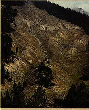
Die Waldbrandfläche Il Fuorn entstand 1951 als Folge menschlicher Unachtsamkeit. Seite 18