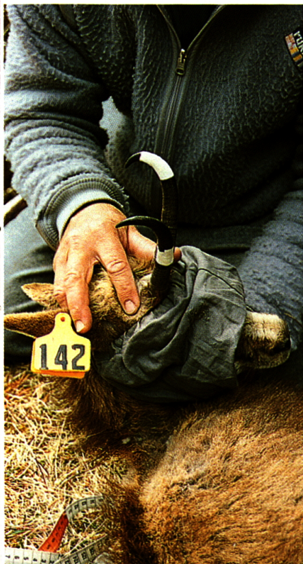
Markierte Geiss Nr. 142 (La Semplice, die Bescheidene). Mit der zusätzlichen Markierung an den Hörnern, links oben weiss und rechts Mitte weiss, ist La Semplice auch aus grösserer Distanz identifizierbar.

Um die natürlichen Regulationsmechanismen der Gemsbestände kennenzulernen, muss man zuerst die Ökologie der Gemse, d.h. die Wechselwirkungen zwischen dieser Tierart und ihrer Umwelt, studieren. Dabei standen folgende Fragen im Vordergrund: Wie nutzen die Gemsen den Raum? Wo halten sich die einzelnen Individuen auf? Wie gross sind die von ihnen genutzten Aufenthaltsgebiete? In welchem sozialen Umfeld halten sich die Tiere auf? Mit Beobachtungen von Juni bis Oktober der Jahre 1996 und 1997 versuchte ich diese Fragen zu beantworten. Ich nahm zu diesem Zweck 3 Tierklassen unter die Lupe: Geissen mit Kitz, Geissen ohne Kitz (aber geschlechtsreif) und Böcke (6-jährige und ältere).