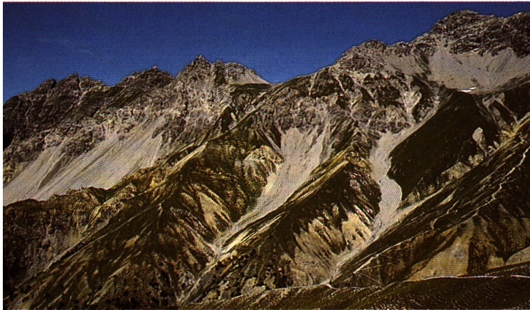
Val dal Botsch, das Tal der Gemen. Die Wahrscheinlichkeit ist hoch, hier eine markierte Gemse anzutreffen.

6.35 Uhr, ich erreiche meinen Beobachtungsposten in der Nähe von Margunet. Eine eisige Brise bewegt die dünnen Grashalme. In der Val dal Botsch herrscht Ruhe. Im Morgengrauen ist plötzlich Hufschlag zu hören – zunächst von fern, dann näher kommend. Ein Gemsbock erscheint auf einer Kuppe, er rennt, als ginge es um sein Leben. Ein zweiter Bock wird sichtbar, er verfolgt den ersten. Solche Verfolgungsjagen zwischen zwei Böcken sind im Sommer selten zu beobachten. Ich richte meinen Feldstecher auf sie. Rasch nähern sich die Tiere, bis ich ihr Keuchen vernehmen kann. In rasendem Tempo jagen sie an mir vorbei, und ich erkenne einen Gegenstand am linken Ohr des Verfolgers – dieser Bock ist markiert! Nach kurzem Zögern richte ich mein Fernrohr auf ihn. Noch bevor er aus meinem Blickfeld verschwindet, kann ich die Zahl 107 auf der gelben Ohrmarke ablesen. Aha – es ist Il capo. Er muss wieder einmal zeigen, wer im Gebiet der Chef ist!