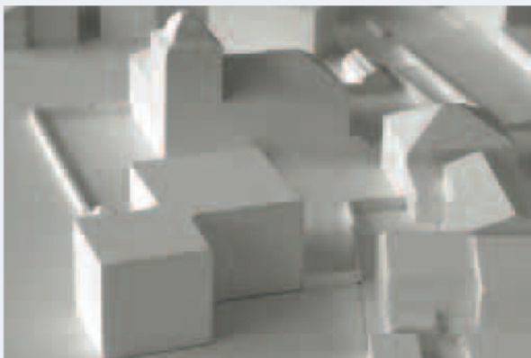
Modell des neuen Nationalparkzentrums

Grossschutzgebiete Die Teilrevision des Bundesgesetzes über den Natur- und Heimatschutz (NHG) ging im Herbst in die Vernehmlassung. Dabei geht es um eine neue Rechtsgrundlage für die zu schaffenden Grossschutzgebiete in der Schweiz. Die Revision sieht vor, die Stiftung Schweizerischer Nationalpark aufzulösen und die bestehenden Verträge in die neue Regelung überzuführen. Zudem soll der SNP längerfristig eine Umgebungszone ausweisen. In ihren Stellungnahmen haben sich der SNP, der Kanton Graubünden, die Nationalparkregion und die Nationalparkgemeinden klar gegen dieses Vorgehen ausgesprochen. Der bald 90 Jahre alte Nationalpark soll seinen Sonderstatus als Schutzgebiet der Kategorie I nach internationaler Naturschutzunion (IUCN) beibehalten und die Stiftung soll bestehen bleiben. Zudem soll die Schaffung einer Umgebungszone auf Freiwilligkeit beruhen, wie diese ja auch für die Schaffung von neuen Grossschutzgebieten im Gesetzesentwurf explizit formuliert wird.