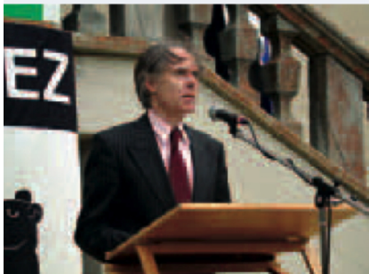
Bundesrat Moritz Leuenberger lancierte am 28. Juni zusammen mit Vertretern der Gemeinde, des Nationalparks und des Hauptsponsors Swisscom die Idee des neuen Nationalparkzentrums.

Nationalparkzentrum Am 25. April gab die Gemeindeversammlung von Zernez einstimmig grünes Licht für die Nutzung des Areals von Schloss Planta-Wildenberg als Nationalparkzentrum. Bereits am 18. Oktober erkor das Preisgericht aus 13 Wettbewerbsprojekten jenes des Architekten Valerio Olgiati zum Sieger.