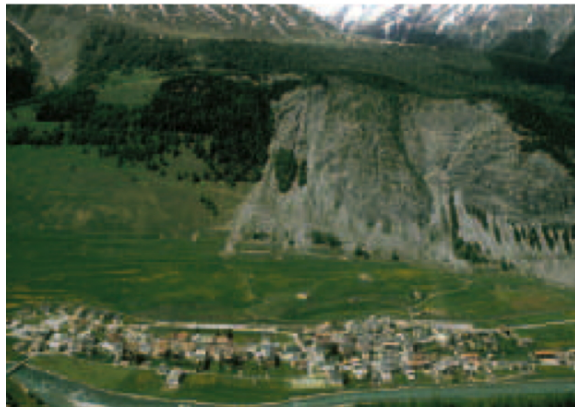
S-chanf, die einzige Nationalparkgemeinde des Oberengadins mit Blick gegen Nordwesten.

Auf dem Weg zur Innbrücke kommen wir ausgangs Dorf am alten Zollhaus vorbei, das bis in die 1960er Jahre in Betrieb war; ein Hinweis darauf, dass die Gemeinde S-chanf 11 Kilometer Grenze mit Italien teilt. Über den Pass Chaschauna verlief in früheren Jahrhunderten die sogenannte Veltlineroute, auf der Veltliner Wein von Italien weiter über den Scalettapass nach Mittel- und Nordbünden