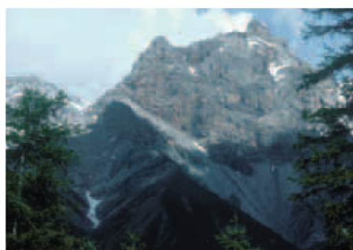
Der Piz Fier weist mit seiner charakteristischen Rotfärbung auf einen erhöhten Gehalt an Eisen hin.

Eine wichtigere Bedeutung kam zweifellos der Alpwirtschaft zu. Während Jahrhunderten wurden die Alpen Purcher und Trupchun vorwiegend von Bergamasker Hirten mit ihren Schafherden bestossen. Die Maul- und Klauenseuche setzte dieser Tradition Anfang des 20. Jahrhunderts unvermit-