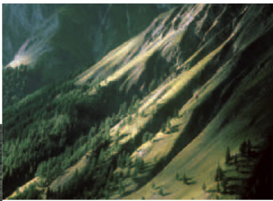
Dieser Wald gliedert sich in Superfizien der Gemeinden S-chanf, Madulain und La Punt Chamues-ch.