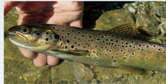
Bachforelle auf Macun mit ihrer für diesen Standort typischen schlanken Körperform