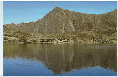
Lai Grond, der grösste der Macun-Seen, beherbergt individuenreiche Populationen von Bachforellen und Amerikanischen Seesaiblingen.

Dennoch: In verschiedenen Nationalparkgewässern lassen sich die Lebensbedingungen für die ursprünglichen Fischarten noch verbessern. So haben die derzeit laufenden Versuche mit künstlichen Hochwassern im Spöl wieder Bedingungen geschaffen, die denen natürlicher Hochgebirgsbäche nahe kommen und eine gesunde, sich selbst erhaltende Bachforellenpopulation fördern. Eine ebenfalls wichtige Massnahme ist der Bau einer Fischtreppe bei der Mess-Station La Drossa, welche den Bachforellen den Aufstieg in den Fuornbach ermöglicht.