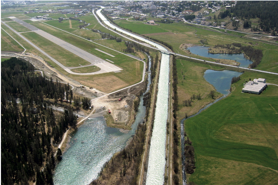
Bild 1: Bauarbeiten zur Verlegung des Flazbaches mit neuer Mündung in den Inn oberhalb des Gravatscha-Sees