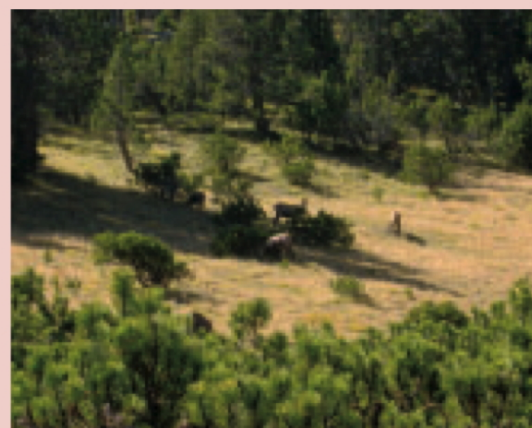
Gämsen auf Champlönch beim Pilzmahl

Die Sporen können keimen, wenn irgendwo, wie zum Beispiel auf Champlönch, gute Bedingungen herrschen und ein Baumsame in der Nähe keimt. Auf Champlönch gedeihen, aus noch nicht erforschten Gründen, vor allem Körnchenröhrlinge. Bestimmt fressen die Gämsen auch andere Pilze, doch deren Sporen scheinen in dieser Wiese nicht zu keimen. Mit Hilfe der Gämsen wurden also Pilze in die Wiese gebracht, und dadurch konnten darin Samen aus dem Wald keimen. Ganz langsam entwickelt sich aus der Wiese eine Savanne, und die Gämsen spielen bei dieser Landschaftsveränderung eine wichtige Rolle. Sie sind sozusagen «Natur-Landschaftsgärtner», denn ohne ihre Mithilfe würde der Wald noch langsamer und ausschliesslich vom Waldrand aus vordringen. Fressen Gämsen und Hirsche die jungen Bäume ab, haben wir gefragt. Nein, sie helfen bei der Wiederbewaldung, und diese geht sehr langsam, aber stetig voran. 🌱