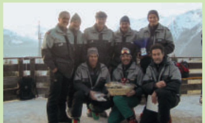
Das Parkwächterteam am Trofeo Danilo Re

Die Ausrüstung der Parkaufsicht wurde mit neuen Swarovski Kompaktfernrohren, leichteren Stativen und multifunktionalen Digitalkameras auf den neuesten Stand gebracht. Ein neuer Toyota Hilux 4x4 mit Dieselmotor, Doppelkabine und Alubrücke ersetzte den 17-jährigen VW-Transporter.