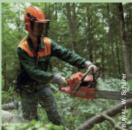
Wald – unverzichtbarer Arbeitsplatz.

Für den Bund sind künftig die Schutzfunktion und die Artenvielfalt prioritär. Finanziell wird er sich hauptsächlich für die Verbesserung der Schutzleistung oder die Artenvielfalt engagieren. Damit das möglich wird, müssen die betroffenen Wälder nach gesamtschweizerisch einheitlichen Kriterien ausgeschieden werden.