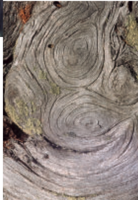
Der Existenzkampf prägt die Stämme der letzten Arven an der Waldgrenze.

schlag gezeichnet. Die Morgensonne schlägt ihre langen Schatten durch den Wald, Gämssen huschen davon. Fichtenkreuzschnäbel ziehen im Familienverband über die Wanderer hinweg und lassen sich durch lautes Rufen vernehmen.