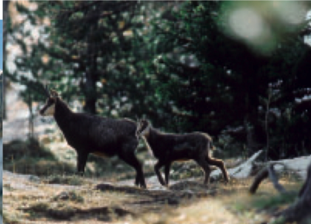
Im morgendlichen Zwielicht huscht eine Gamsgeiss mit ihrem Kitz vorbei.