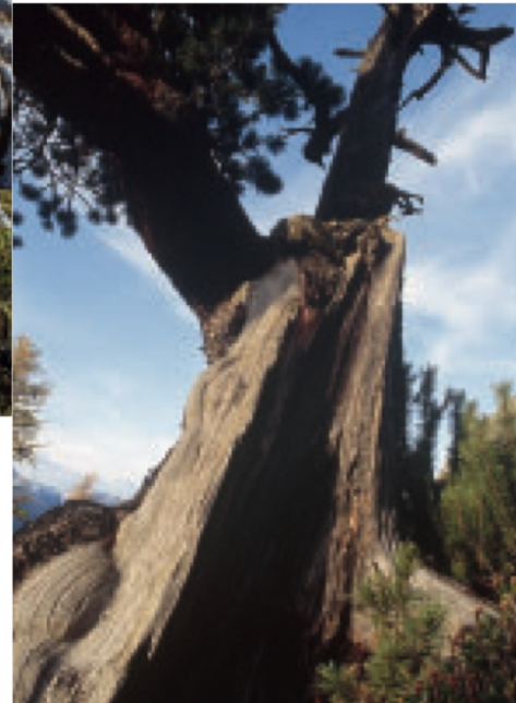
Gezeichnet von Blitz und Sturm trotz dieser Arve den Unbilden des alpinen Klimas.

geniessen eine einzigartige Aussicht ins Cluozzatal. Der Bach glitzert im Gegenlicht, die Hütte erscheint klein wie ein Sandkorn. Da oben beginnt das Paradies der Schneehasen, Schneehühner, Schneemäuse und Hermeline. Der verkarstete Fels mit seinen zahlreichen Spalten bietet gute Deckung und Schutz vor dem Wind. Nicht selten kreist auch das Steinalderpaar der Val Cluozza über uns – auf der Suche nach einem unvorsichtigen Murmeltier oder Schneehasen. Das Paar hat seinen Horst tief unten in der Cluozzaschlucht errichtet.