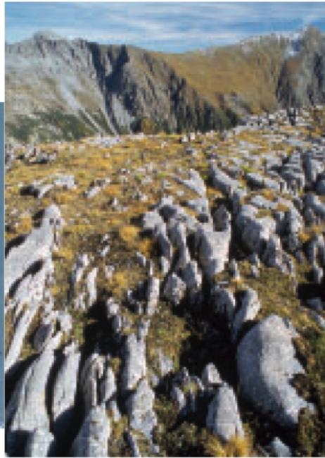
Über der verkarsteten Krete öffnet sich der Blick in die Val Cluozza. Auffallend ist die grüne Wiese Murter. In dieser geologischen Senke stehen fossilreiche Kalke an, auf denen der Bewuchs viel stärker ist als auf dem kargen Dolomit.