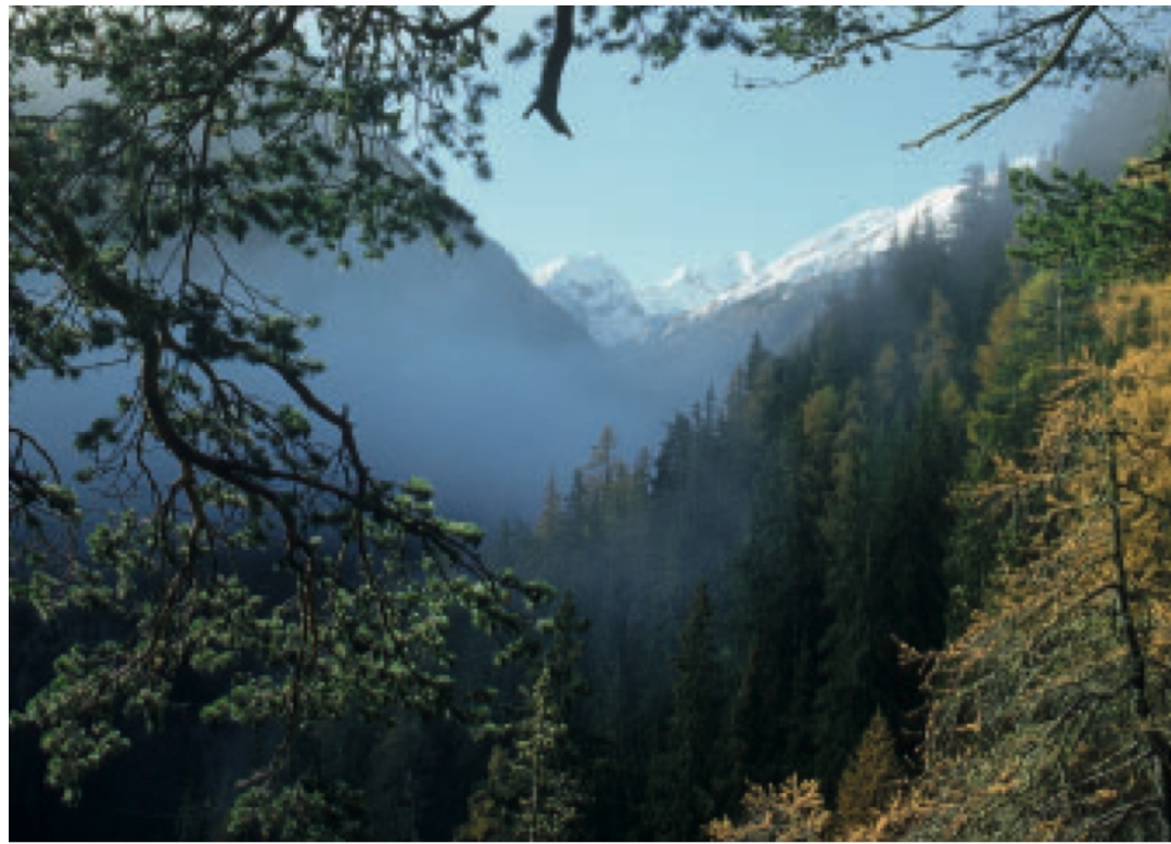
Beim Gedenkstein für Paul Sarasin, Mitbegründer des Nationalparks, öffnet sich ein fantastischer Blick in die wilde Val Cluozza.