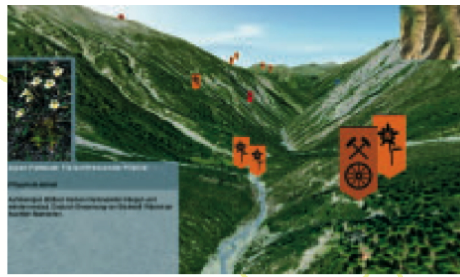
Abbildung 2: Der Nationalpark grenzenlos: Virtueller Flug durch die Val Cluozza