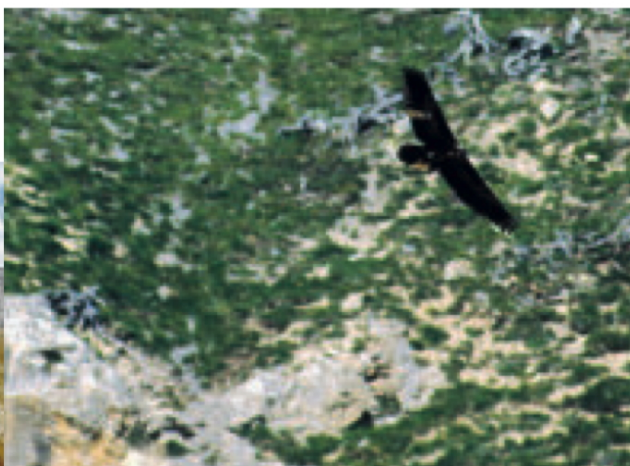
Ein junger, markierter Bartgeier kreist über der Aussetzungshöhle.